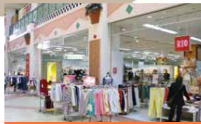
シーズントレンドをいち早く取り入れたファッションエリア